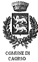
COMUNE DI CAORSO