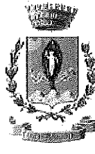
COMUNE DI MONTICELLI D'ONGINA